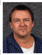
Ragnar Didrik Osdal